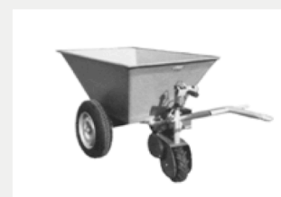
Silowagen mit Elektroantrieb